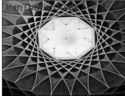
شکل ۱-۳ یک اثر معماری

گاه برای نشان دادن یک دستگاه، شیء یا رویداد، تنها از عکس می‌توان کمک گرفت. هرگاه جزء خاصی از عکس مورد نظر است، باید به‌گونه‌ای تهیه شود که اجزای فرعی چشمگیرتر از جزء مورد نظر نباشد (شکل ۱-۲).